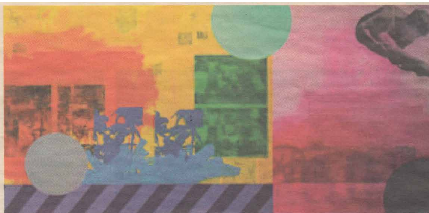
Verk av Daniel Birgersson.