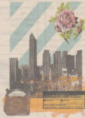
Målning i blandteknik av Daniel Birgersson.

OCH DET ÄR just här, i sökandet och mångtydigheten, som konsten uppstår – när alla begrepp osäkras. Daniel Birgerssons målningar bär på dubbla budskap: här finns